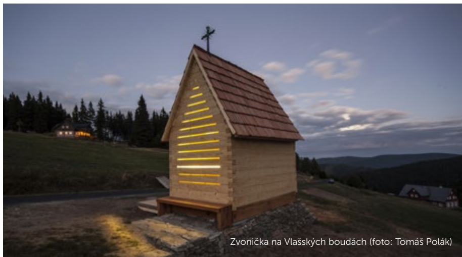
Zvonička na Vlašských boudách