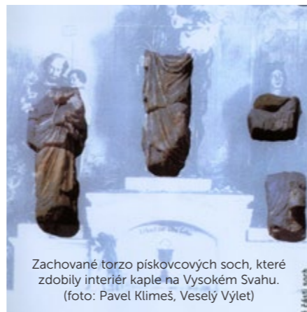
Zachované torzo pískovcových soch, které zdobily interiér kaple na Vysokém Svahu.

podle polohy slunce během roku. Paprsek osvětlí hranol uprostřed, který karminově červenou barvou ozáří aktuální znamení zvěrokruhu, které bude na zdi. Tím, že je z původní stavby jen torzo a není možná „doslovná“ rekonstrukce, dává nám to možnost postavit na Vysokém Svahu kapličku, která bude unikátní,“ říká Pavel Klimeš. Na městě má tento projekt zelenou a Pec je připravena pomoc s financováním celého projektu. Dojde na ni ale patrně až po roce 2018, až město dokončí klíčové stavby jako jsou garážové domy a parkoviště. ❁