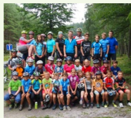
Závody, které TJ pořádá v letošní sezóně:

pomoci. A šlo o to pomoci konkrétním dětem. Přišlo mi to lepší než poslat peníze na sbírku, nebo dobročinným organizacím, kde není jasné, na co se dané peníze využijí.“ Tradice obdarování vrchlabských dětí pokračuje dál. Letos tyto aktivity převzala paní Yveta Ivanková. A všechny děti z DD Vrchlabí se i letos mohou těšit na vysněné dárky. Za to patří dík nejen Marii Skalické a Yvetě Ivankové, ale i všem adoptivním matkám z Pece a Velké Úpy, které se za 16 let do této tradice zapojily. ❁