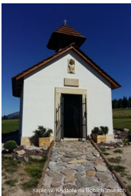
Kaple sv. Kryštofa na Bobích loukách