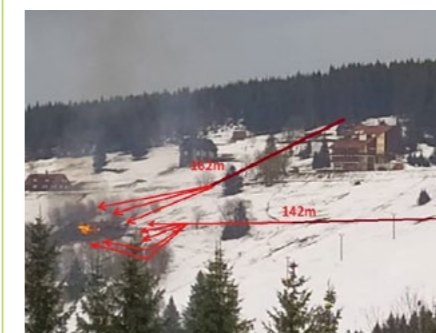
Příčina požáru Bažiny nebyla přímo stanovena. Vyšetřování bylo uzavřeno s třemi možnými verzemi – vada komínového tělesa, závada na elektroinstalaci nebo nedbalost při vynášení popela, který vlivem silného větru mohl zalétnout pod obložení domu.

Doulíkovi a dalším chatařům, které nelze všechny jmenovat a kteří neváhali pomoci právě s důležitým transportem. Poskytnutí vodních zdrojů umožnil personál hotelu Emerich a zaměstnanci SkiResortu ČERNÁ HORA – PEC.