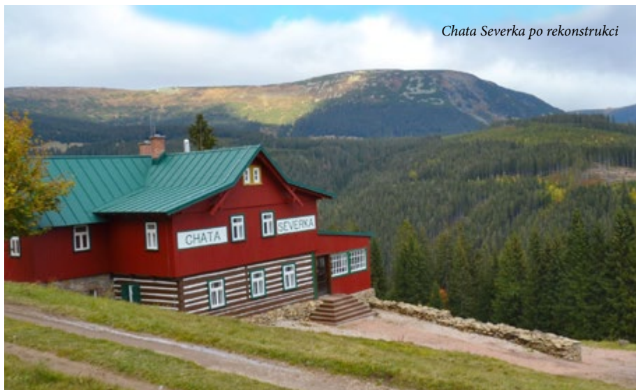
Chata Severka po rekonstrukci