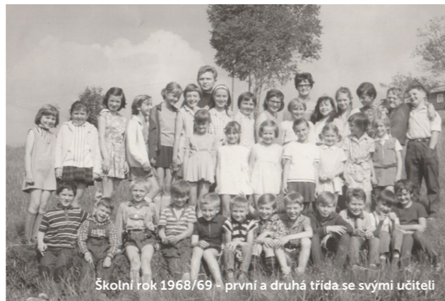
Školní rok 1968/69 – první a druhá třída se svými učiteli

A co byste od učitele asi nečekali? Třeba, že každý rok v srpnu natírá šedým lakem podlahy ve třídách a na chodbách. Nebo že si ze sklepa nosí plný uhlák, aby bylo čím topit v kamnech. Nebo že o prázdninách