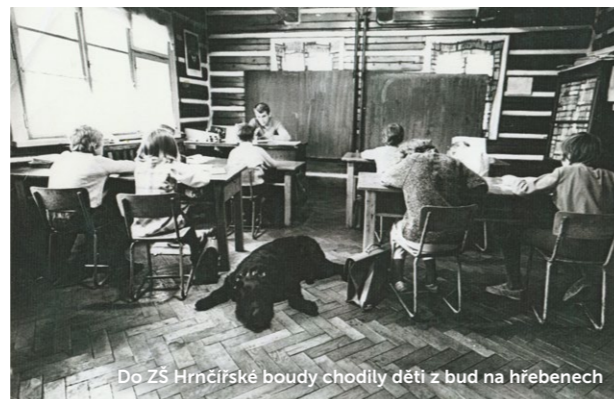
Do ZŠ Hrnčířské boudy chodily děti z bud na hřebenech

Ani nejvýše položené škole v Česku se ale nevyhnula ideologická témata. „Jednomu ze školních inspektorů například vadilo, že podobizna prezidenta Husáka nevisí na čelní straně s tabulí, ale na boční stěně třídy. Argument, že na čelní straně