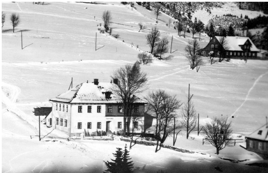
Budova školy pochází z roku 1834, stávající podobu ale dostala až později.