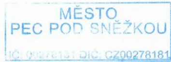
..... Alan Tomášek, starosta města Pec pod Sněžkou